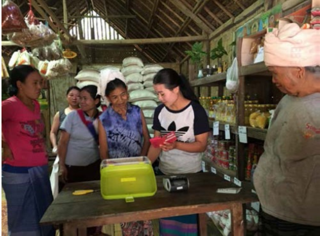
ဘန့်မဲနန်းဆွယ်စခန်းမှ FCS ကဒ်ဖြင့် ဈေးရောင်းချသူ

နစ်နာလွယ်မှုကို လျော့ချနိုင်စေရန်ပံ့ပိုးမှုဖြစ်စေပါလိမ့်မည်။ ၂၀၁၈ ခုနှစ်၏ ပထမ ၆-လတွင်