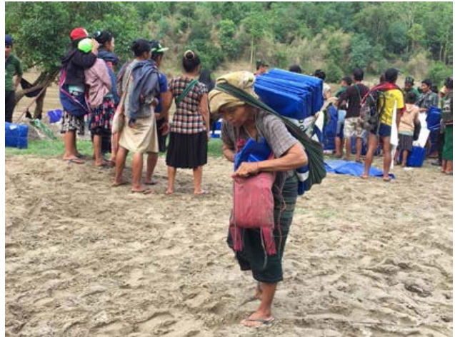
၂၀၁၈၊ ဇွန်လအတွင်း ဖာပွန်မြို့နယ်တွင် အရေးပေါ်အကူအညီ ဖြန့်ဖြူးပေးစဉ်

မြန်မာနိုင်ငံတွင် TBC အဖွဲ့က အရပ်ဘက်လူမှုအဖွဲ့အစည်း မိတ်ဖက်အင်အားစုများနှင့် လုပ်ဆောင်နေပြီး၊ ရေရှည် ကာလကြာမြင့်စွာပဋိပက္ခဒဏ်ခံစားခဲ့ကြရသည့် ရပ်ရွာများ ပြန်လည်နာလံထူရေးအား ပံ့ပိုးပေးနေသည်။ သို့မှသာ အချိန်တန်၍ အိမ်ပြန်လာကြမည့်ဒုက္ခသည်များ ဝင်ရောက် လာကြသည့်အခါ လက်ခံနိုင်စွမ်း မြင့်မားမည် ဖြစ်သည်။ ၂၀၁၈ ခုနှစ်၏ ပထမ ၆-လပိုင်းတွင် ထိုလုပ်ငန်းရပ် ကို အထောက်အကူပြုရန်အတွက် ဒုက္ခသည် ခေါင်းဆောင် များ၊ တိုင်းရင်းသား လက်နက်ကိုင်အင်အားစုများ (EAOs)၊ အရပ်ဘက်လူမှုအဖွဲ့အစည်းများ (CSOs) နှင့် ညှိနှိုင်းတိုင်ပင်၍ ဒုက္ခသည်များ အိမ်ပြန်ရေးတွင် ပိုမို ထောက်ပံ့ပေးနိုင်ရန်အတွက်လုပ်ထုံးလုပ်နည်းများ၊