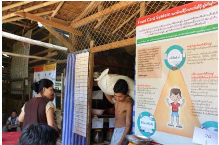
FCS ကဒ်ဖြင့် ရောင်းချသည့်ဆိုင်တစ်ခုတွင် အရေးပါသည့် အာဟာရရရှိရေး ပညာပေး ဖော်ပြထားစဉ်

နှင့် ကျား-မကွဲပြားမှုအပေါ် အခြေခံသည့် အကြမ်းဖက်မှုများ(SGBV)အပေါ်သိမြင်ရန်၊ တာဝန်ယူတာဝန်ခံမှုကလေးများ အပေါ် ကာကွယ်မှုပေးရေး၊ အဖွဲ့အစည်းစီမံခန့်ခွဲမှု၊ စာရင်းကိုင်ပညာ၊ ကျင့်ထုံးများ၊ လုပ်ငန်းများ ထူထောင်ခြင်း၊ ငွေစုငွေချေး၊ အခြေခံစိုက်ပျိုးရေး နှင့် မိခင် အာဟာရရရှိရေး နှင့် ဖြည့်စွက်စာ ကျွေးမွေးမှုကိစ္စများ ဖြစ်ပါသည်။